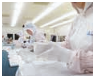
全数検査(クリーンルーム)

納品する容器を細部まで一つひとつ丁寧に人の目で検査。新製品や既存品の全数検査、充填済品のセットアップも行え、安心と共に高品質をお届けします。