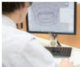
プロダクトデザイン

HATAのインハウスデザイナーは、理想的なデザインにする為に製品に対する想いを伺います。デザイナーの感性と発想力もプラスして、より魅力的なデザインへと仕上げます。