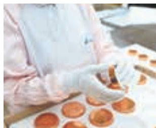
抜取検査(JIS Z 9015)

納品する容器を細部まで一つひとつ丁寧に人の目で検査。新製品や既存品の全数検査、充填済品のセットアップも行え、安心と共に高品質をお届けします。