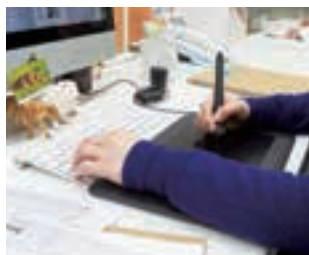
グラフィックデザイン

HATAのインハウスデザイナーは、理想的なデザインにする為に製品に対する想いを伺います。デザイナーの感性と発想力もプラスして、より魅力的なデザインへと仕上げます。